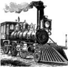
Endüstri Devrimi'nin simgelerinden biri bubarlı lokomotifdir.

Endüstri devriminin en belirgin özellikleri emek sürecinde kapitalist kontrolün ve işbölümünde uzmanlaşmanın artması, madencilik, üretim ve ulaşım alanlarında başta buhar gücü olmak üzere cansız enerji kaynaklarından ve yeni makinelerden ve teknolojilerden faydalanılmasıdır.