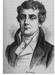
L.G. Ambroise Vicomte de BONALD (1754-1840)

Bonald, Maistre ve diğer bazı gelenekçi düşünürler, toplumu içinde bulunduğu siyasal ve toplumsal krizden çıkarabilmeye yönelik bir çaba olarak devrim öncesi değerlere ve toplumsal yapıya geri dönülmesini istemiş, ancak Saint Simon ve Comte, toplumu krizden çıkaracak olanın geleneksel değerlere dönüş olduğunu düşünmemişlerdir. Saint Simon toplumun yeni yüzyılda çalışma ve işbirliği kavramlarına dayalı bir dizi ahlaki değerle yeniden organize olacağını düşünmüş, Comte ise, toplumun içinde bulunduğu bu durumdan ancak pozitivizm aracılığıyla çıkılabileceğini savunmuştur.