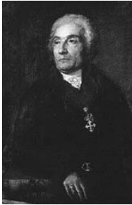
Joseph-Marie de MAISTRE (1753-1821)

18. yüzyılda Aydınlanmanın eleştirel düşüncesinden 19. yüzyılda sosyolojik pozitivism e geçilmesi, Fransız Devrimi'nden sonra gerçekleşmiştir. Fransız Devrimi sonrasında Aydınlanma düşünürleri tarafından akıl dışı oldukları için toplumsal değişme açısından önemsiz görülen kurumların toplumsal değişimde oynadıkları rol fark edilmiş ve Aydınlanma düşünürlerinin bu görüşlerinin yetersizliği ortaya çıkmıştır. Fransız Devrimi ve Endüstri Devrimi ile birlikte siyasal ve toplumsal düzenin alt üst olması, topluma ait geleneksel değerlerin kaybedilmesi ve yeni değerlerin de toplumun sürekliliğini sağlayacağından şüphe edilmesi, toplumsal düzenin bireycilik temelinde yükselen yeni toplum tipinde sağlanamayacağı düşüncesini doğurmuştur. Bu nedenle Fransız Devrimi'nden sonra Aydınlanmanın vurguladığı bireysel hakların önemi azalmış, akılcı ilkeler, hiyerarşi, ödev ve kolektif ya-