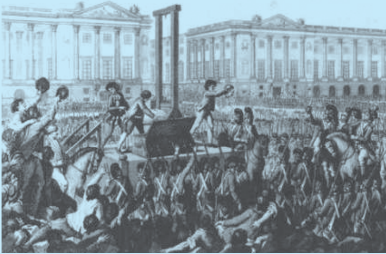
Fransa kralı 16. Lui'nin idamı

Fransız Devrimi, on sekizinci yüzyıl sonunda Fransa'da monarşinin yıkılmasına ve cumhuriyetin kurulmasına yol açan politik olayların bütününe verilen addır. Devrim 1789 yılında başlamış, Kral 16. Lui önce tahttan indirilmiş, ardından kraliyet ailesiyle birlikte idam edilmiş, yönetim radikal grupların eline geçmiş ve izleyen aylarda devrim karşıtı olduğu düşünülen binlerce kişinin idam edildiği bir terör dönemi yaşanmıştır. 1799 yılında Napoleon Bonaparte'in diktatörlüğü ile Fransız Devriminin resmi olarak sona erdiği kabul edilmektedir.